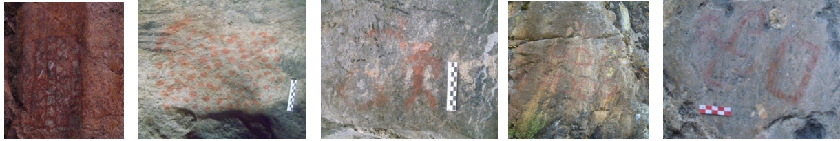
Fig. 9. Tayaqa. Fig. 10. Laja Qaqawasi. Fig. 11. Laja Qaqawasi. Fig. 12. Tambopampa. Fig. 13. Machuqaqa.