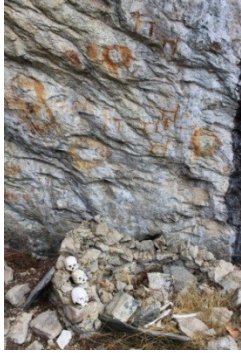
Fig. 15. Carohumiña I. Representación rupestre asociada a Inhumaciones.