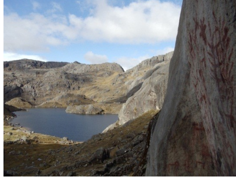
Fig. 16. Hermosa vista tomada desde el propio alero rupestre de Qelqasqaqa.