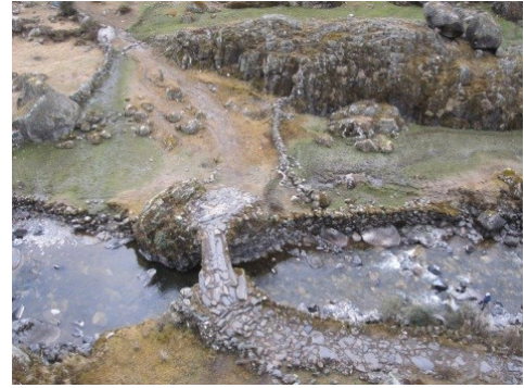
Fig. 18. Vista panorámica del puente Inca Asociado al panel de Tambopampa.