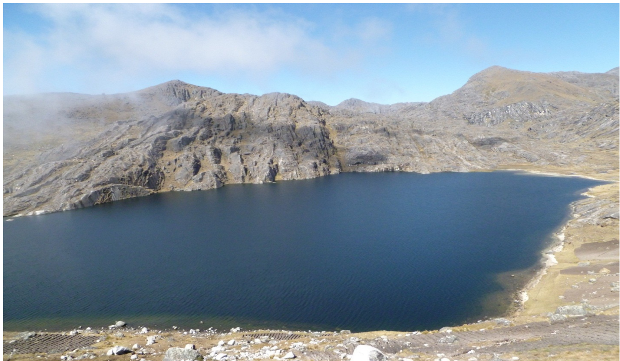
Fig. 14. Laguna de Ch'uaqota. Probablemente las pinturas rupestres estén asociadas a los espejos de agua, En la vista se señala la ubicación de las pinturas rupestre, en el entorno o riberas de la hermosa laguna de origen glaciar.