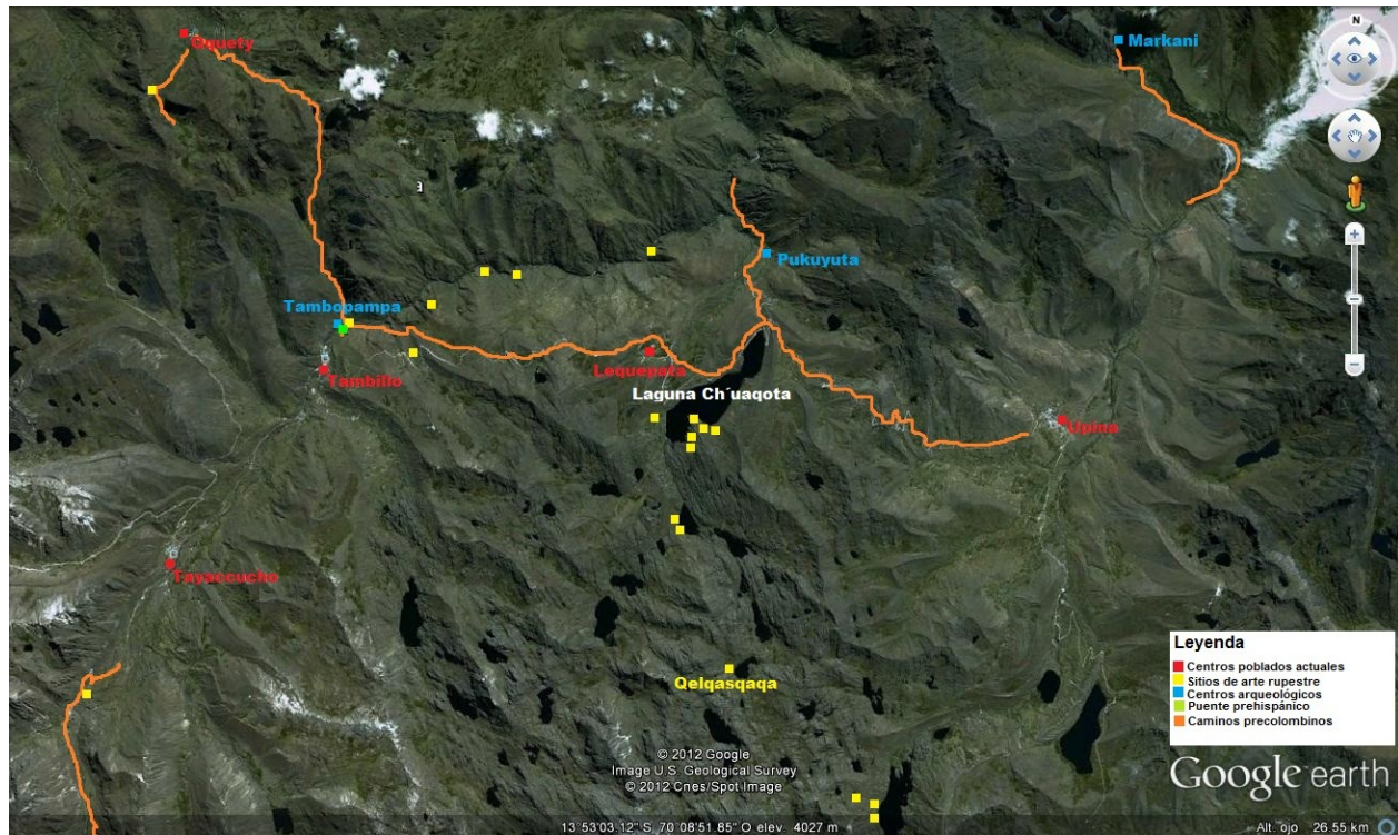
Fig.2. distribución de sitios con representación de arte rupestre en la geomorfología del distrito de Ituata.